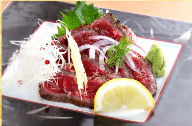
国産牛レアステーキスライス 1,850円