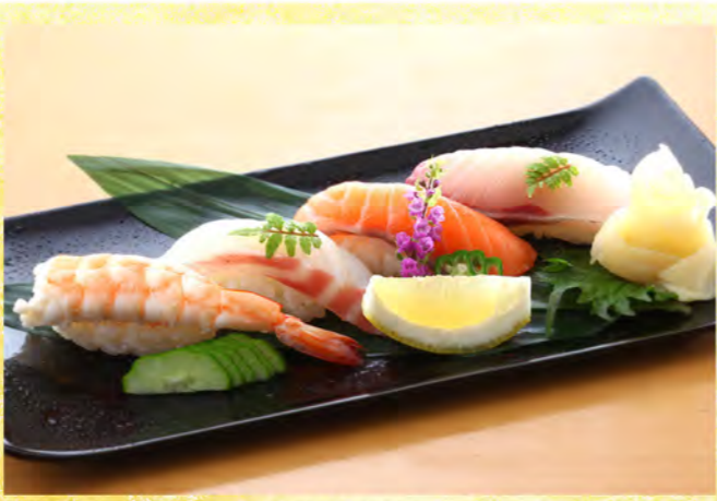
握り寿司 四貫 800円