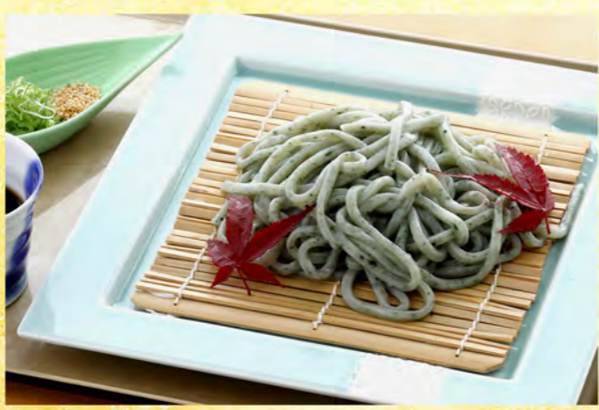
蓬 (よもぎ) うどん 860円