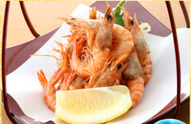
から海老唐揚げ 780円