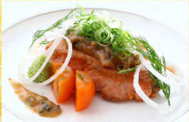
サーモン炙り葱味噌山葵焼 1,080円