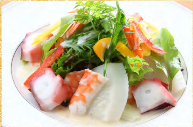
魚介サラダ シーザーソース 1,200円