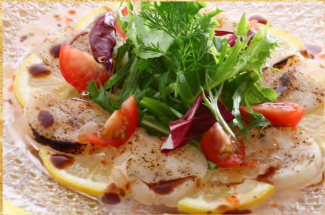
帆立貝炙りサラダ 1,300円