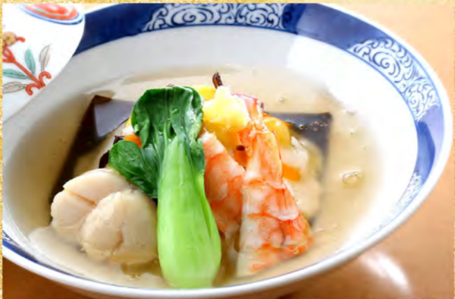
帆立貝海老みぞれ蒸し 680円