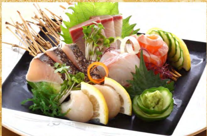
お造り五種盛り 1,900円