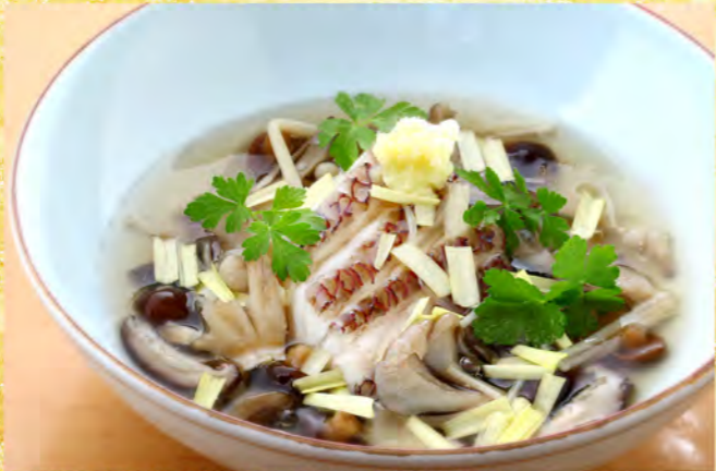
鯛酒蒸し 木の子 黄蕷 餡掛け 1,200円