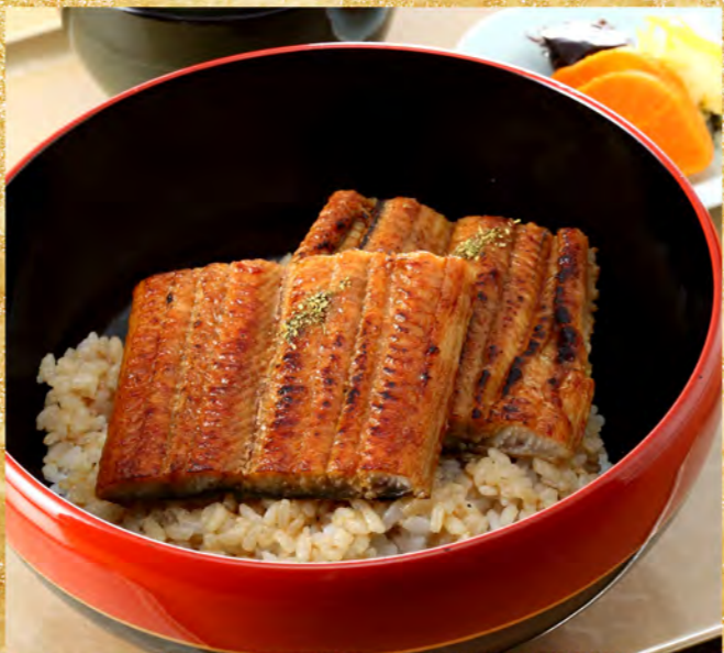
うな丼 (茶碗蒸し・吸物・香の物) 1,700円