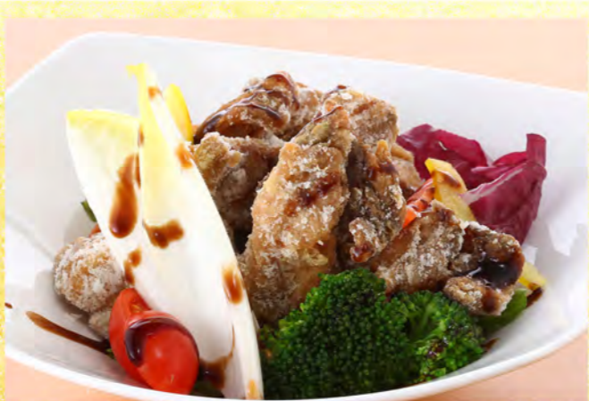
大山鶏バジルの香り揚げ 860円