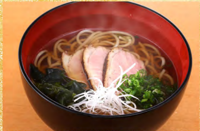
鴨南蛮蕎麦・稲庭うどん 半玉860円