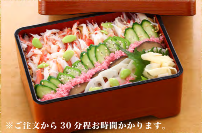
※ご注文から 30 分程お時間がかかります。 ずわい蟹ちらし寿司 1,980円