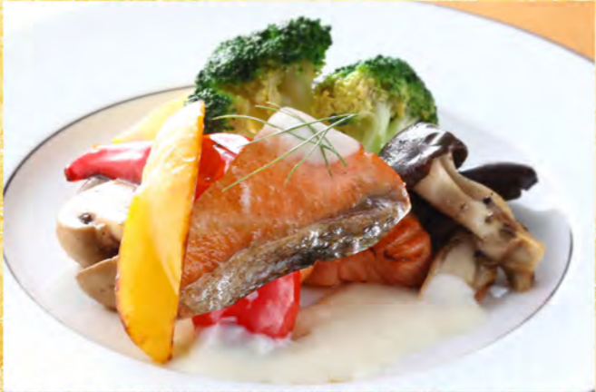
サーモンバターソテー 1,080円