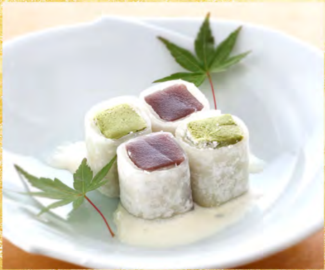
求肥 (ぎゅうひ) クレープ包み 650円 抹茶ムース 生クリームソース掛け