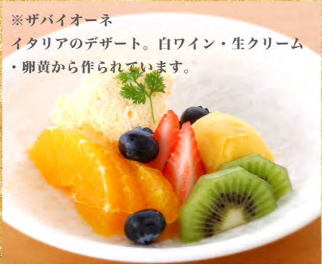
ザバイオーネ 700円 フルーツ&ミニアイス添え