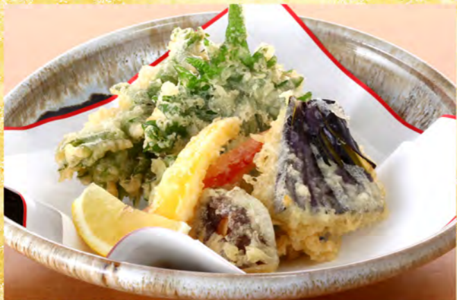
野菜天ぷら五種 580円