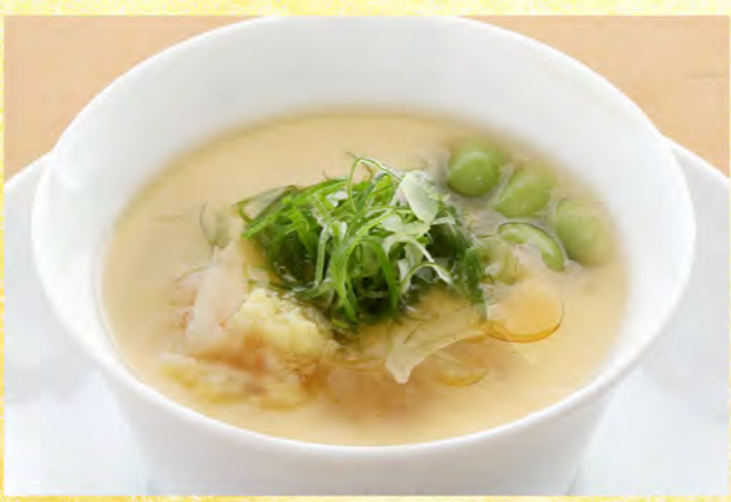
ふかひれと海老の茶碗蒸し 1,200円