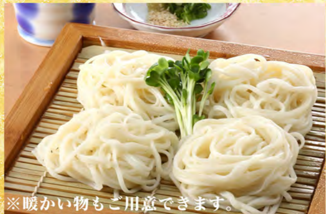
※暖かい物もご用意できます。 稲庭うどん 1玉860円 半玉430円