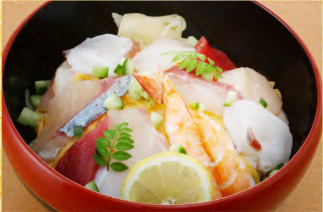
海鮮丼 (茶碗蒸し・吸物・香の物) 1,980円