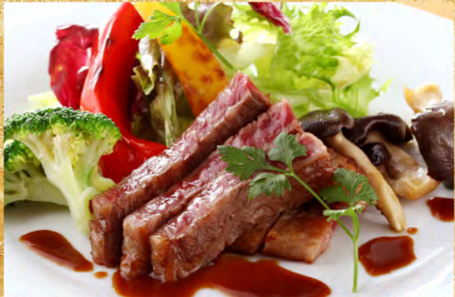
特選黒毛和牛 (100g) 3,240円 ~