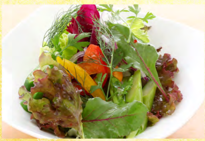
グリーンサラダ 650円