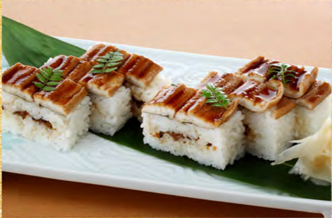
煮穴子箱寿司 六貫 1,250円