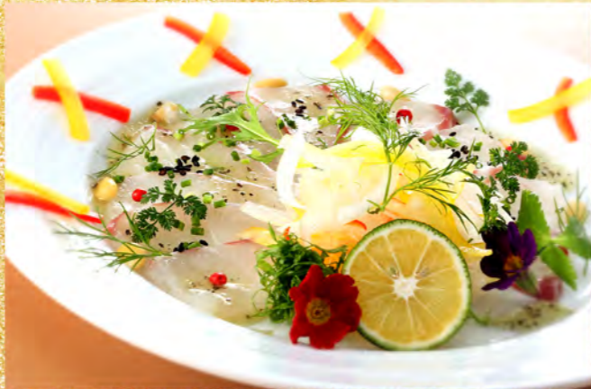
旬の鮮魚カルパッチョ 1,400円