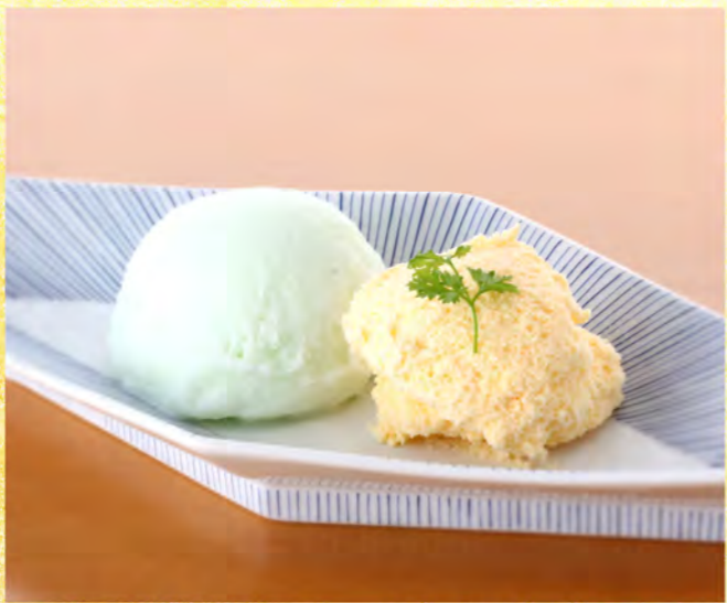
海のアイススペシャル 650円