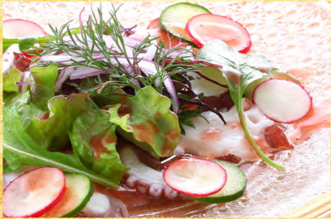
蛸サラダ梅ドレッシング 860円