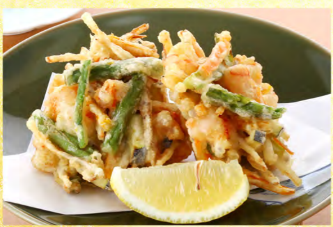
海老アスパラかき揚げ 600円