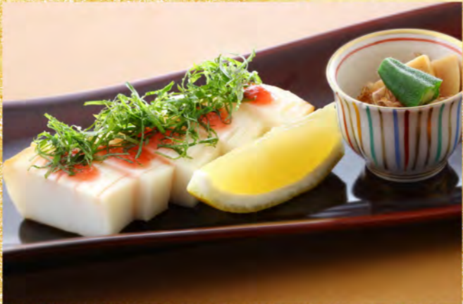
文甲いか青しそ焼 1,080円